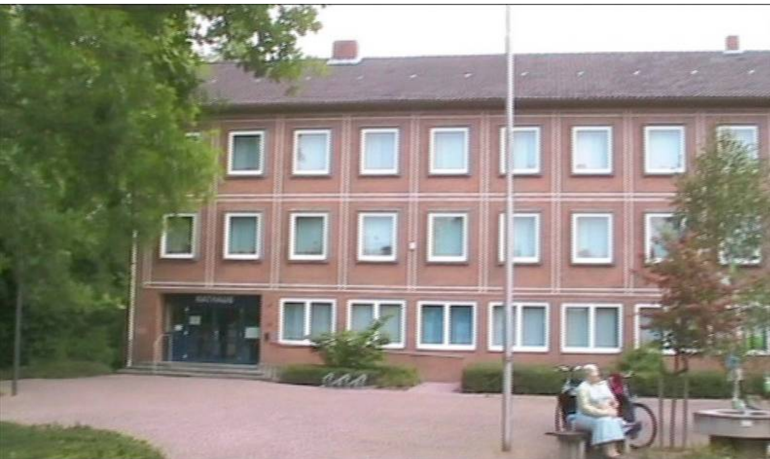
Das Rathaus der Stadt Petershagen. Weitere Bilder finden Sie unter Petershagen Heute“ Teil 2 !