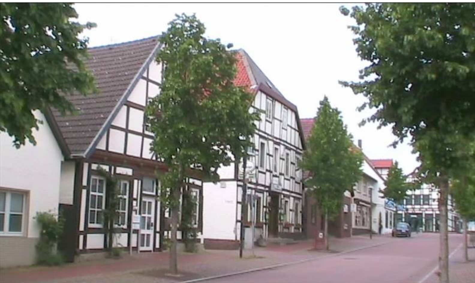
Das Hotel „Deutsches Haus“ in der Bildmitte hat auch schon bessere Tage gesehen !