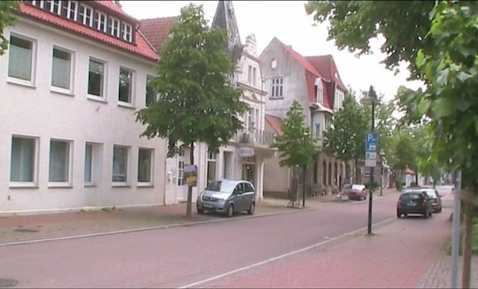
Mindener Str. gegenüber dem alten Amtsgericht.