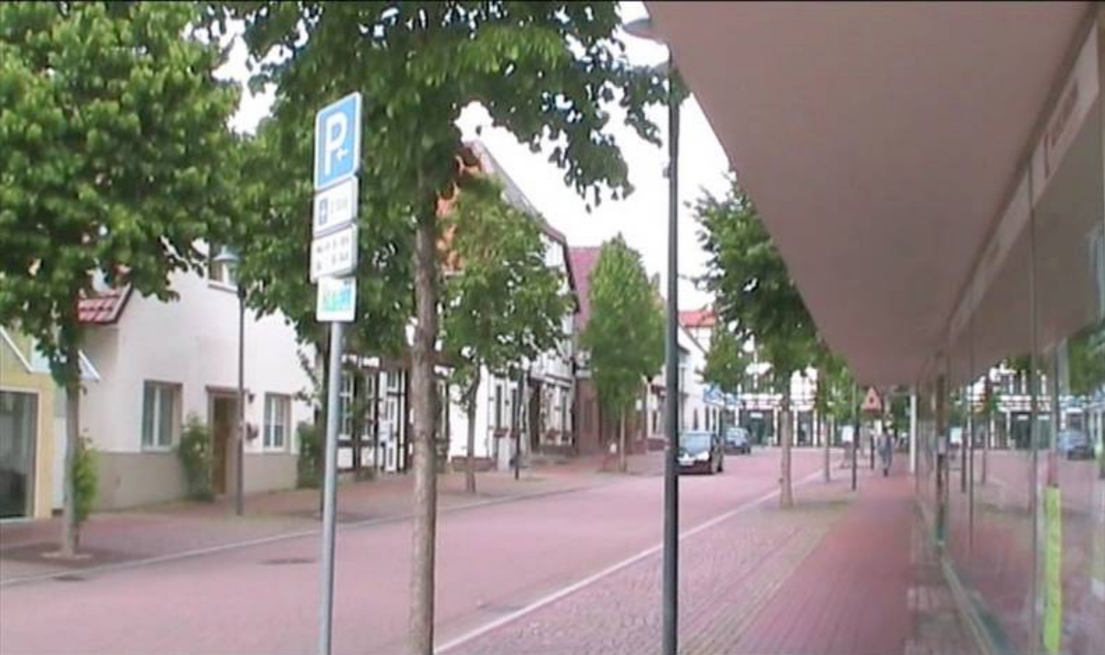
Die Mindener Str. Blickrichtung ehem. Ovenbeck Ecke Hauptstr. (früher Bahnhofstr.).