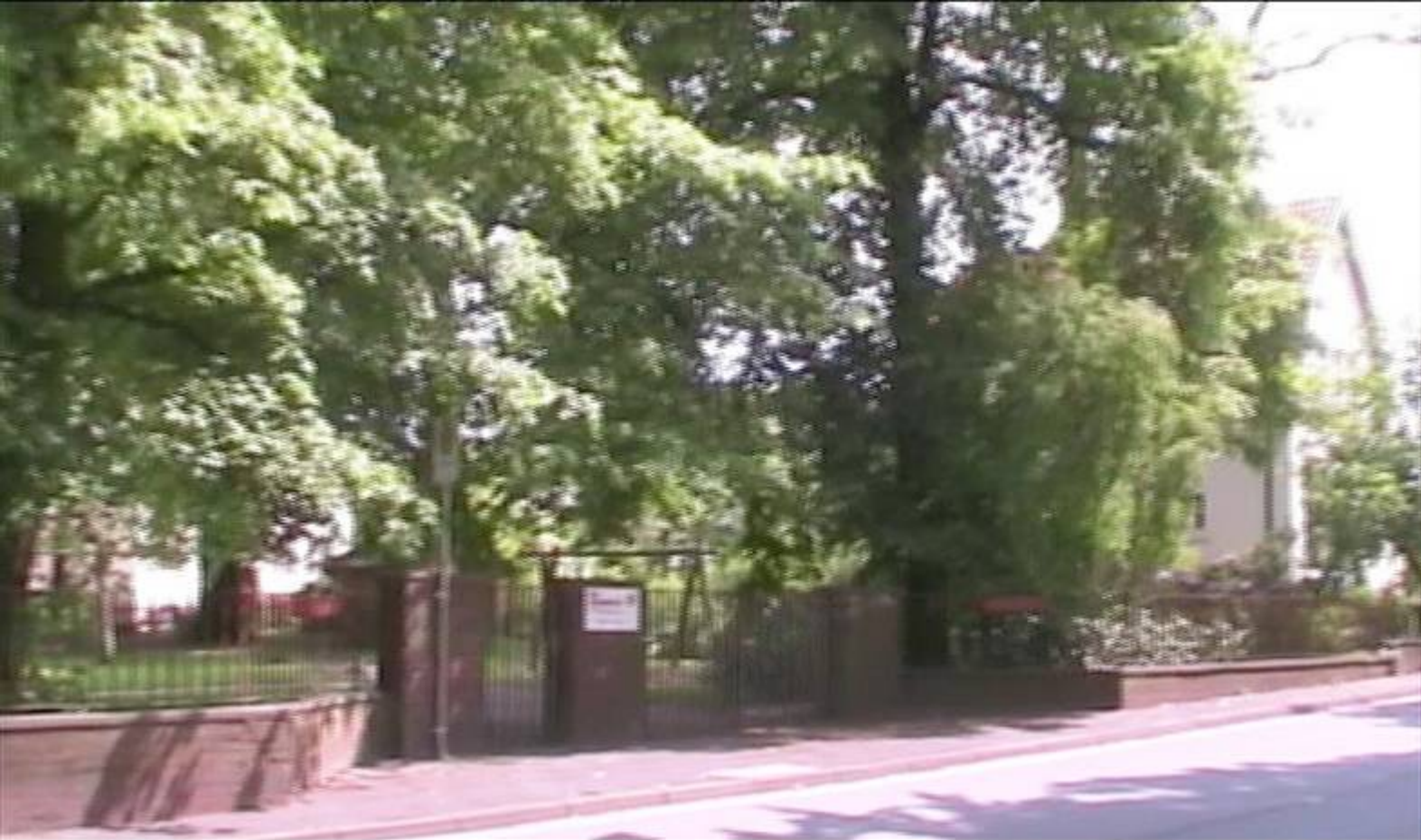
Links der Eingang der ehem. Schifferschule in der Mindener Str., im Hintergrund das Haus in dem damals mein Schulfreund Wolfgang Lips wohnte.