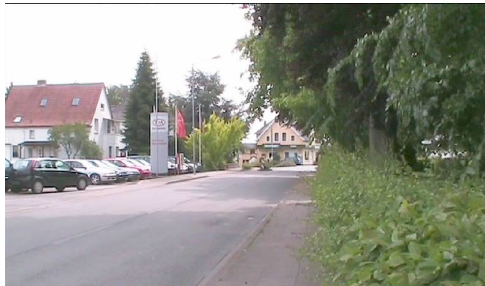
Die gleiche Blickrichtung, links das Gelände ehem. Ballhaus und rechts der Friedhof.