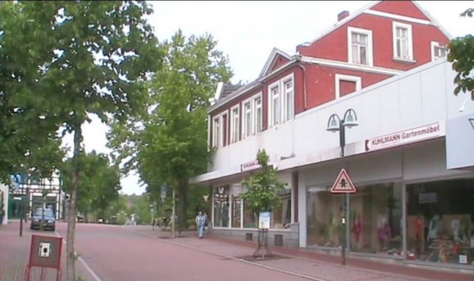
Das ehemalige Modehaus Kanning.