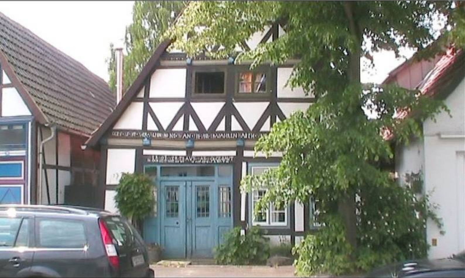
Wieder zurück in der Mindener Strasse.