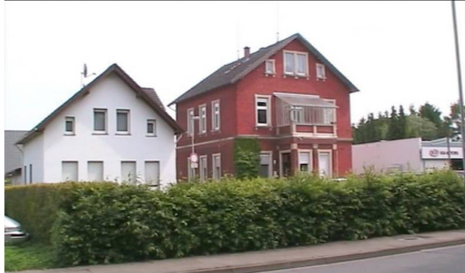
Links das Haus Halbrock, das Vaterhaus meiner Oma, rechts ehem. Ballhaus.