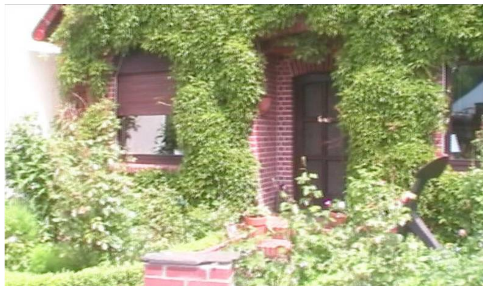
Links im Wohnzimmer habe ich so manche Stunde verbracht.