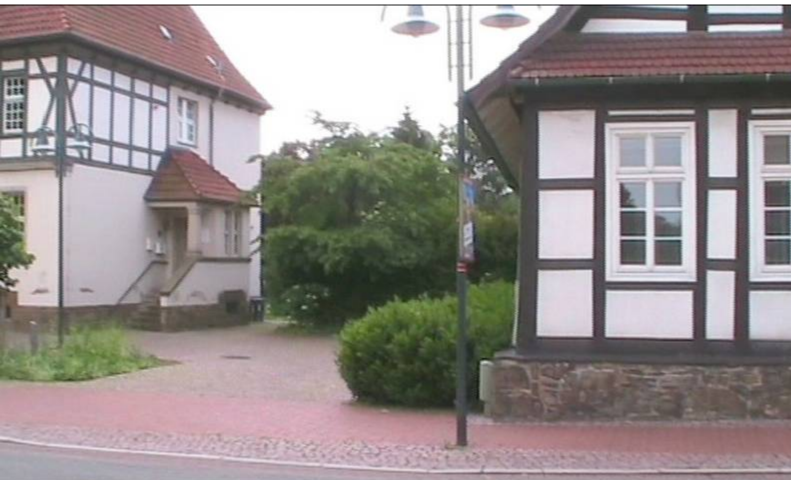
Direkt links neben dem rechten Haus ging anstelle der Büsche die Ösper unter der Mindener Str. hindurch.