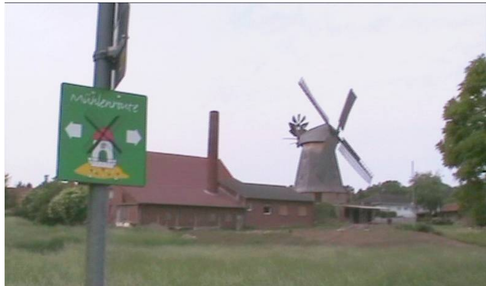
Büschings Mühle, von der Weserseite aus gesehen.