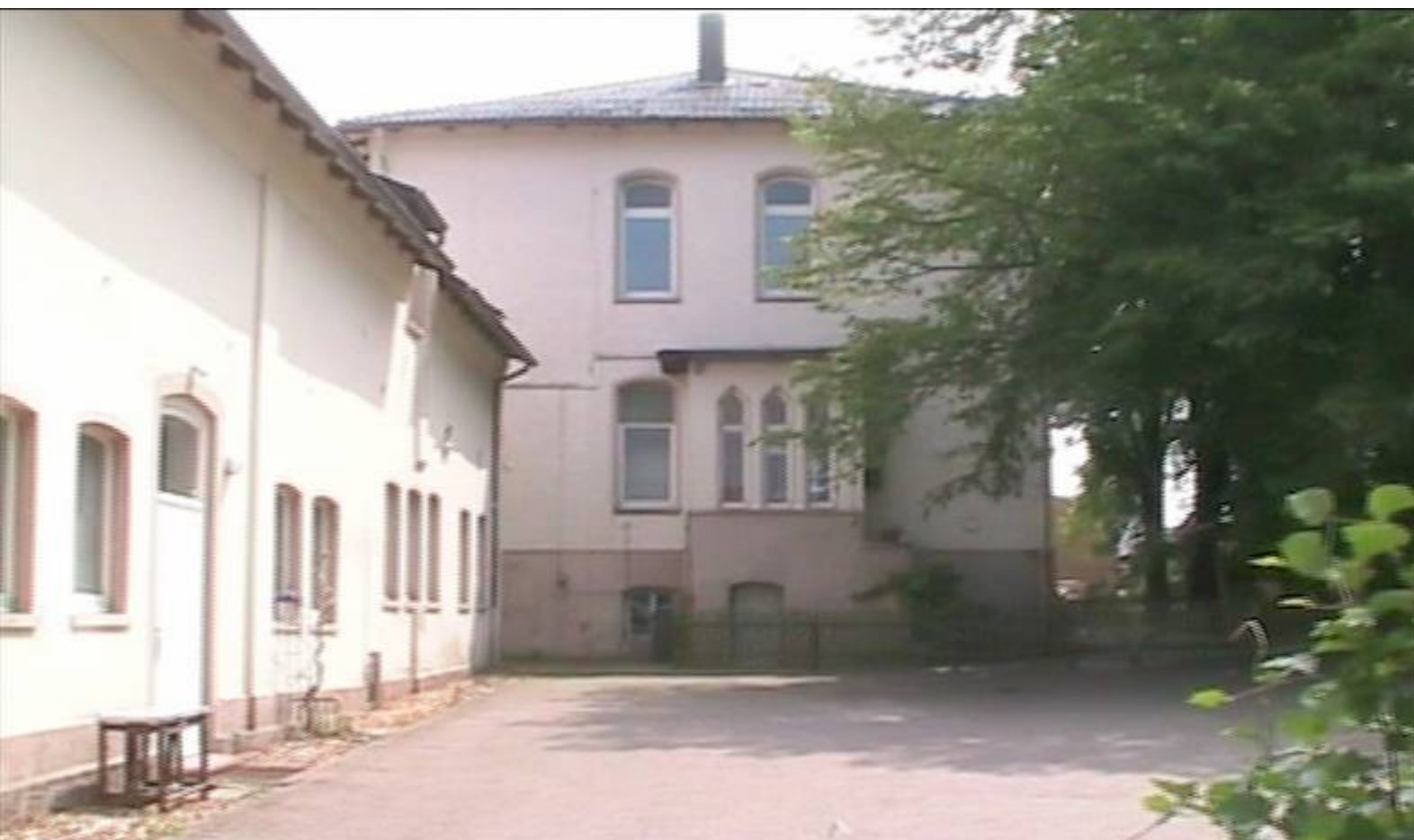
Der Hinterhof der ehem. Schifferschule.