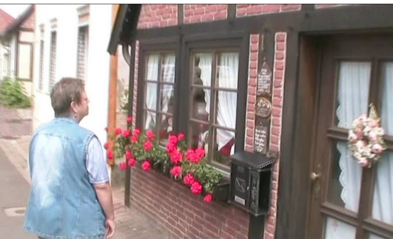
Weitere Eindrücke aus der Fischerstadt.