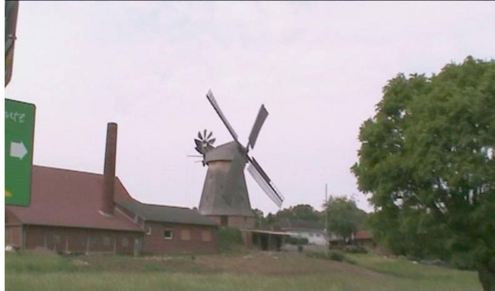
Noch einmal Büschings Mühle, renoviert und im neuen Glanz.